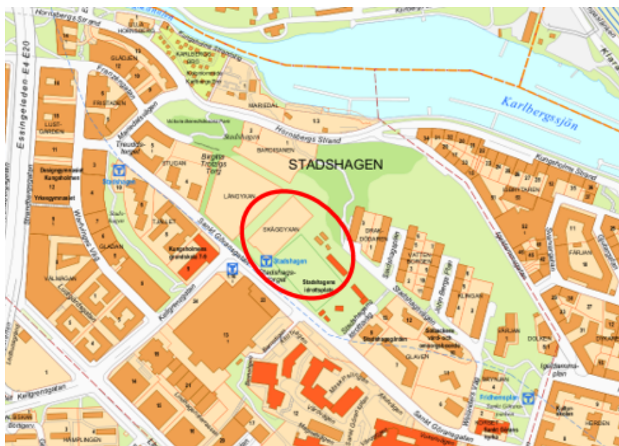
Projektet Skäggyxan i Stadshagen.

Till följd av de ändrade förutsättningarna föreslogs ett vård- och omsorgsboende på platsen. Micasa genomförde under hösten 2025 en volymstudie och slutsatsen av denna var att, med en ny detaljplan, kan ett vård- och omsorgsboende med upp till 100 lägenheter tillskapas.